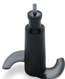
Nůž pro hnětení