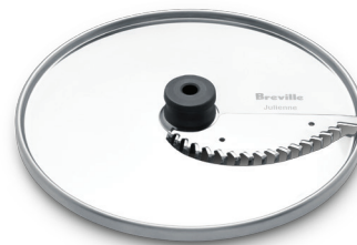
Disk na krájení na jemné proužky