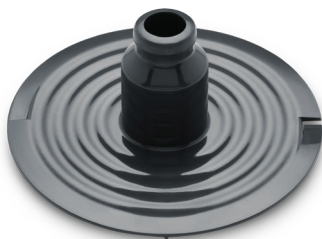
Disk ke šlehání emulzí