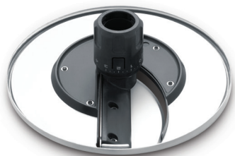
Krájecí disk s nastavitelnou výškou krájení