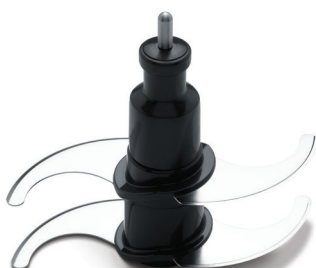
Dvojitý sekací nůž QUAD™