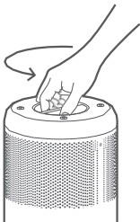
Odstranění starého filtru

Otočte čistič dnem vzhůru a otočte filtr proti směru hodinových ručiček, abyste ho vyjmuli.