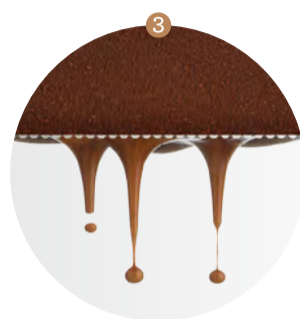
3 Nízkotlaková preinfúzia a extrakcia pri tlaku 9 barov.