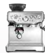
BES870 the Barista Express™