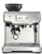
BES880 the Barista Touch™

Nová generácia plne automatického pákového kávovaru.