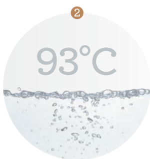
2 Absolútna kontrola nad teplotou.