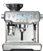
BES980 the Oracle®