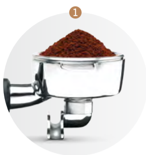
1 Dávka mletej kávy 19 – 22 g (dve šálky).