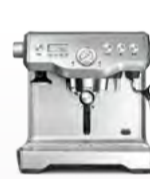
BES920 the Dual Boiler™