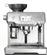
BES990 the Oracle® Touch