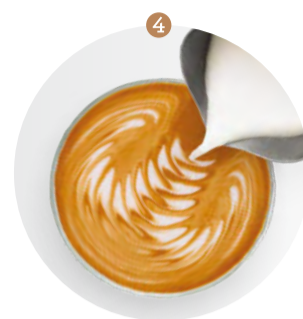
4 Hodvábne jemná mliečna pena s mikrobublinami.